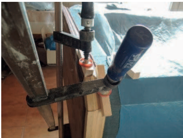
Fot. 7. Gzyms w trakcie konserwacji

dawnych napraw i wyrazem przywiązania właścicieli do mebla. Przeważały jednak argumenty za przywróceniem pierwotnego wyglądu szafy. Zdjęto zatem formę z oryginalnego gzymsu i tej na podstawie, zamówiono specjalny frez, za pomocą którego wykonano brakujące fragmenty listwy wieńczącej, po czym zamocowano ją na korpusie szafy i zrekonstruowano na niej polichromię 18 .