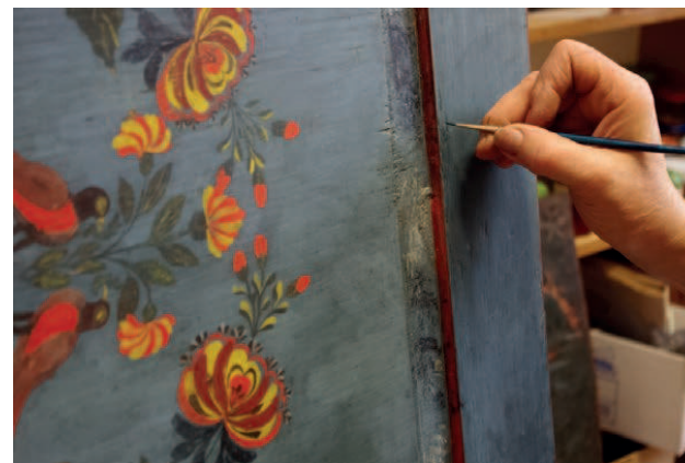
Fot. 6. Polichromie w trakcie konserwacji

kwiatów, stojących w cebulastym czerwono-żółtym wazonie na wiotkiej nóżce z nodusem. Bukiet jest ukształtowany symetrycznie, tworzy wzór gwiazdy. Kielichy kwiatów mają różne kształty: tulipanowate, wielopłatkowe i baldachowe. Pomiędzy płycinami umieszczono żółtą inskrypcję ROKU 1848 17 . Gzymsy wieńczący, malowany na ciemnoczerwono pokryto podobnie jak obramienia płycin granatowymi i żółtymi kropkami.