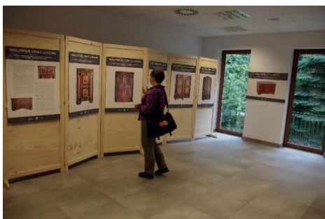
Fot. 9. Wystawa „Malowane meble ludowe ze zbiorów Muzeum »Górnośląski Park Etnograficzny w Chorzowie« i Muzeum Górnośląskiego”