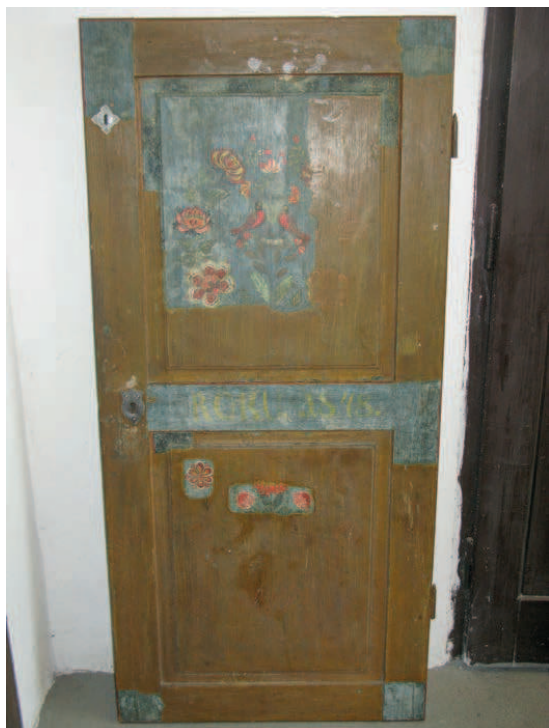
Fot. 3. Odkrywki na drzwiach