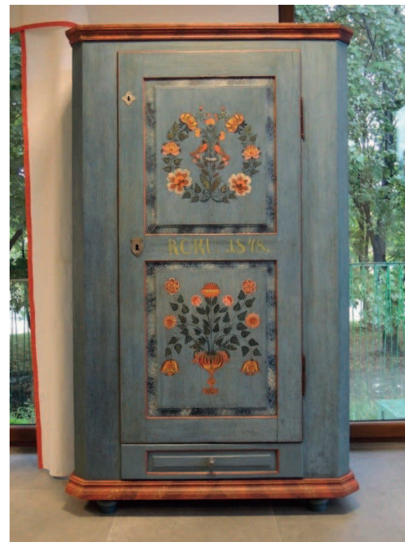
Fot. 8. Mebel po konserwacji

Kolejny problem stanowiła rekonstrukcja szuflady dolnej. Oryginalna szuflada nie zachowała się, mebel po zbadaniu przetarł malatury i śladów po obiciach dostarczył jedynie informacji o rozmiarach czoła szuflady i sposobie jej osadzenia. Projekt nowej został opracowany w pracowni konserwatorskiej Muzeum przez Małgorzatę Książek w oparciu o analizę podobnych obiektów. Na jego podstawie zrekonstruowano brakujący element. Ze względu na bardzo ozdobny charakter mebla zdecydowano się na wzór szuflady z centralną płyciną. Czoło szuflady pokryto błękitną malaturą, krawędzie płyciny podkreślono ciemnoczerwoną obwódką. Zasadę analogii przyjęto także przy odtwarzaniu nóżek i gzymsu dolnego. Na gzymsie dolnym zdecydowano się powtórzyć wzór i kolorystykę polichromii z gzymsu górnego. Na zakończenie mebel zabezpieczono werniksem (natryskowo) i woskiem oraz delikatnie wypolerowano.