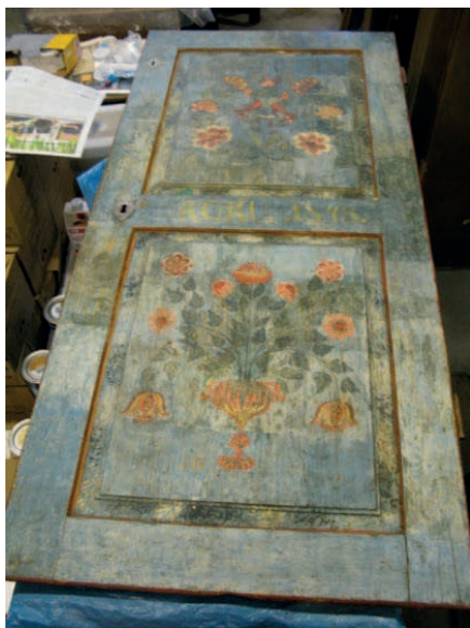
Fot. 5. Drzwi po zdjęciu przemalowań