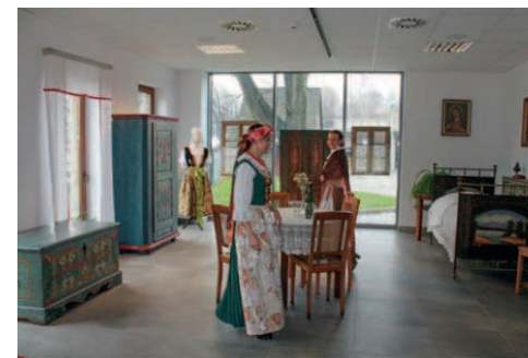
Fot. 10. Wystawa „Malowane meble ludowe ze zbiorów Muzeum »Górnośląski Park Etnograficzny w Chorzowie« i Muzeum Górnośląskiego”

analizując skrzynie cieszyńskie podkreśla, że najpopularniejszym kolorem była co prawda zieleń, jednakże używano także niebieskiego i brązowego 21 . Typowe jest także zastosowanie spoiw olejnych 22 . Wyjątkowe podobieństwo w zakresie motywów i kolorystyki do chorzowskiego obiektu wykazuje skrzynia ze zbiorów Muzeum Górnośląskiego pochodząca z Lesznej w powiecie cieszyńskim, datowana na 1860 rok 23 , zbyt wcześnie jednak na postawienie tezy o pochodzeniu obu mebli z tego samego warsztatu.