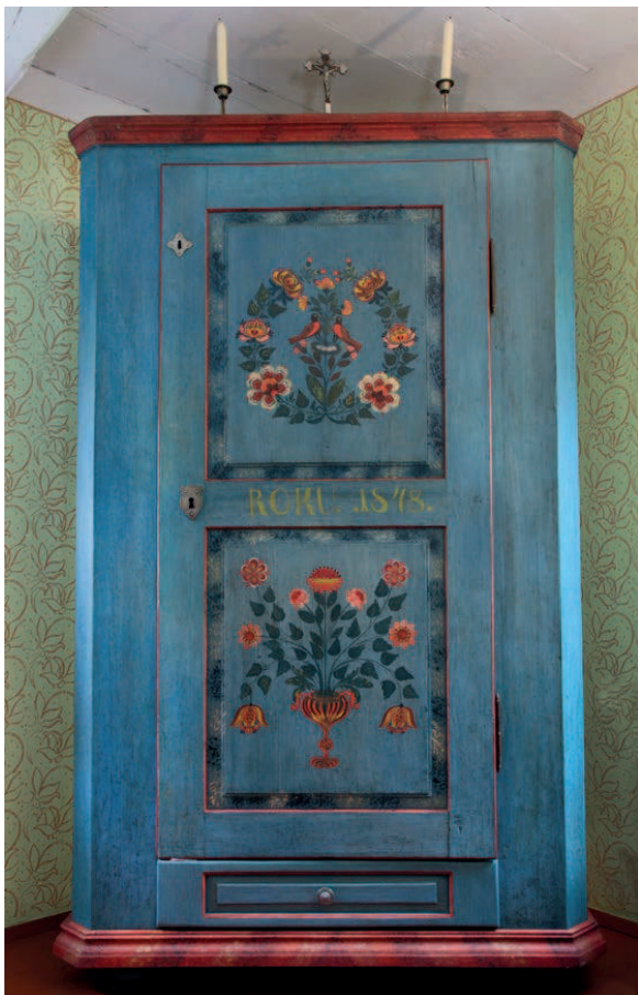
Fot. 11. Szafa na ekspozycji muzealnej w izbie wycużnej chałupy z Golezowa

– w izbie wycużnej chałupy z Golezowa. Będzie zatem prezentowany w miejscu, z którego pochodzi.