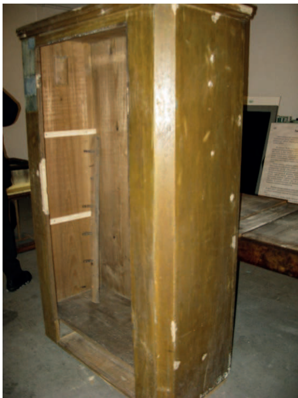
Fot. 1. Szafa przed konserwacją