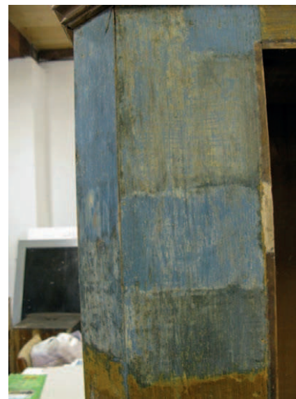
Fot. 2. Odkrytki na ścianach szafy. Widoczny stan pierwotnych polichromii

plyniny. Od góry wieńczy ją wydatny, profilowany gzyms. Zbudowana jest z drewna sosnowego, w konstrukcji skrzyniowej. Boki zostały wykonane z jednej deski, ścianka tylna z dwóch desek. Główne płyty konstrukcyjne są mocowane kołkami drewnianymi, listwy czołowe i dno łączone na wczepy skośne, drzwi w konstrukcji ramowo-ptycinowej, gzyms wieńczący nakładany i mocowany kołkami.